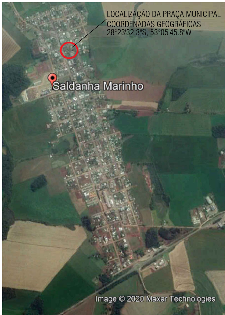
— ARQ PLANTA DE SITUAÇÃO ESC: SEM ESCALA