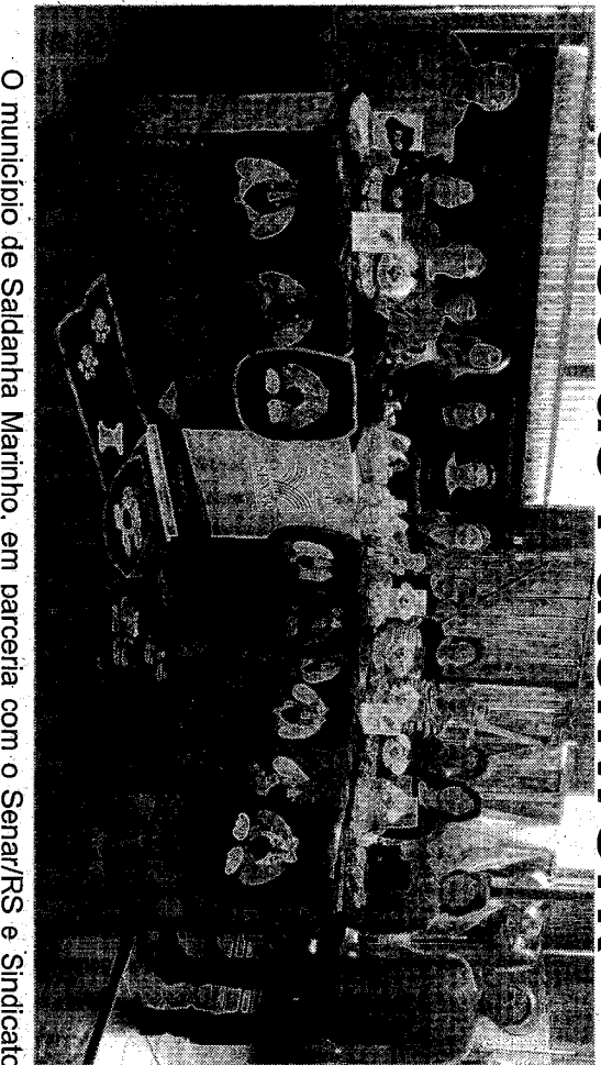
O município de Saldanha Marinho, em parceria com o Senar/RS e Sindicato